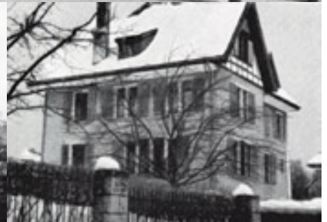
Orte des Grauens, teilweise bis Mitte der siebziger Jahre: Speisesaal des Kinderheims Rathausen (oben), Kinderheim «Paradies» in Mettmenstetten (unten links), Waisenhaus «Mariahilf» in Laufen (unten Mitte), Töchterinstitut «auf der Steig» in Schaffhausen (unten rechts)

«In der Kirche beteten sie, und zurück im Heim schlugen sie uns mit Knüppel und Rohrstock, bis wir grün und blau waren. Sie wollten Kinder zurechtbiegen, wollten sie brechen, angeblich zu ihrem eigenen Wohl.» Irgendwann hat sie angefangen, sich zu wehren. «Wenn ich geprügelt wurde und den Stock zu fassen bekam, schlug ich zurück. Dann hiess es wieder, ich sei halt ein böses Kind.»